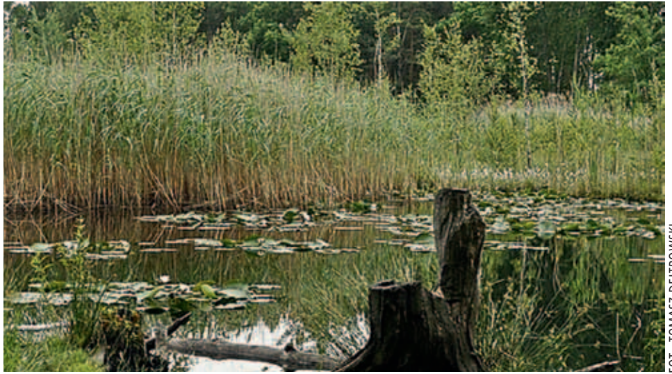
Urokliwe Jezioro Torfy

W ostatnim roku zaczęto popularyzować w Wawrze narciarstwo biegowe. Duży w tym udział trzech prywatnych wypożyczalni sprzętu narciarskiego. Warto