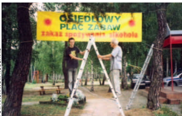
Plac zabaw przy ul. Izbickiej, oczko w głowie przewodniczącego rady osiedla