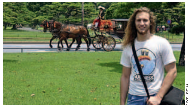
W parku widzieli karetę z cesarzem Akihito