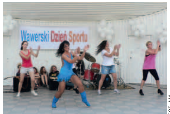
Żywiolowy taniec w części artystycznej Wawerskiego Dnia Sportu