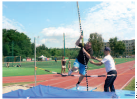
Niektórzy próbowali swych sił w skoku o tyczce

Nie brakowało też konkursów, a jeden z nich polegał na jak najdłuższym trzymaniu powietrza w płucach, był przegląd zajęć oferowanych przez Fitness Anin i quiz wiedzy o wawerskich klubach sportowych,