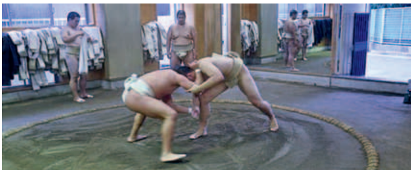
Na Uniwersytecie Nihon podpatrywali Japończyków