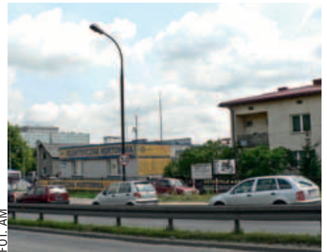
Tym firmom i hurtowniom grozi przesłonięcie ekranami dźwiękochłonnymi

Wału Miedzeszyńskiego. Rzecz jednak w tym, że ekrany pełne tłumią hałas, a przezroczyste tylko go odbijają.